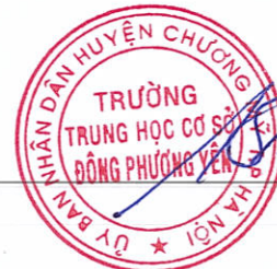
Đỗ Bình Luận